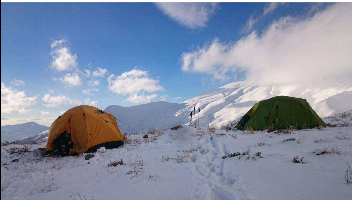
عکس های برنامه: